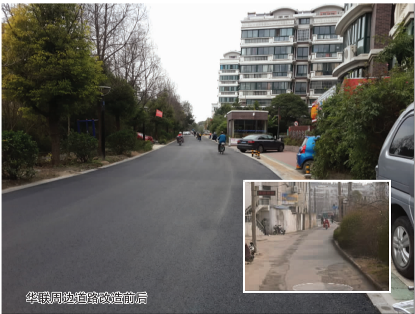
华联周边道路改造前后

为提升城市品位，美化市容市貌，改善城市形象，市城建控股集团实施道路亮化提升工程，在朝阳东路、海连路(幸福路-凌州路)、郁洲路(人民路-海宁路)、苍梧路(华联广场-苍梧桥)、瀛洲路(华联广场-海宁路)等路段安装路灯6000余套，线条灯5000余米。目前朝阳东路试验段已完工并投入使用，其余亮化工程正在序时推进，预计在春节前全部完成，营造节日期间的热烈氛围。