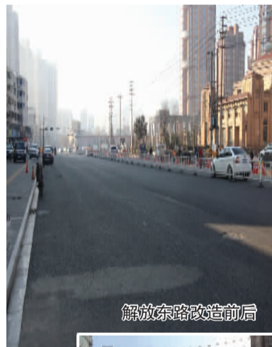
解放东路改造前后