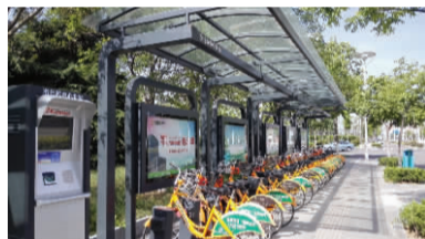
公共自行车市行政中心站

院、城建大厦、市科技馆、金海影城、连云港实验学校、海州高级中学等7个停车场建设，可为社会提供1002个车位。