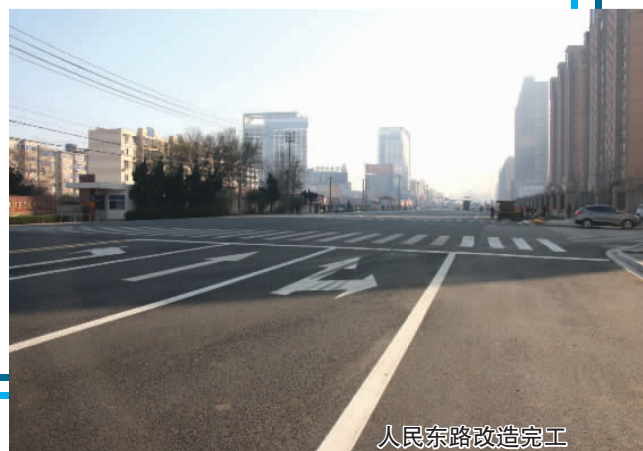
人民东路改造完工