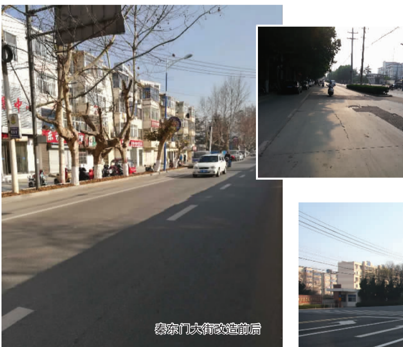
秦东门大街改造前后